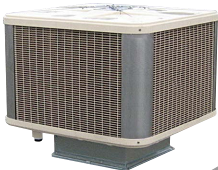
Uscita aria dal basso Air outlet from below