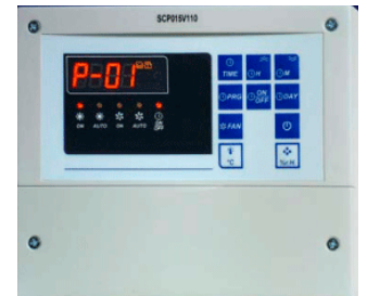
Pannello comandi | Control panel