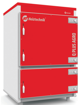
Q PLUS AGRO 110 kW